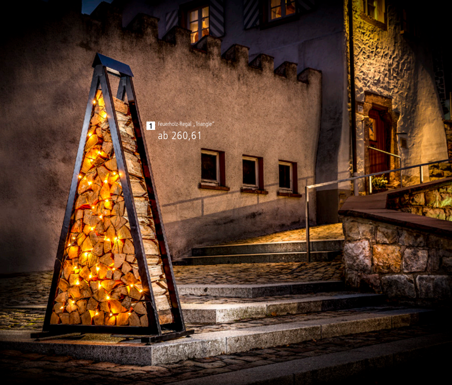
1 Feuerholz-Regal „Triangle“ ab 260,61