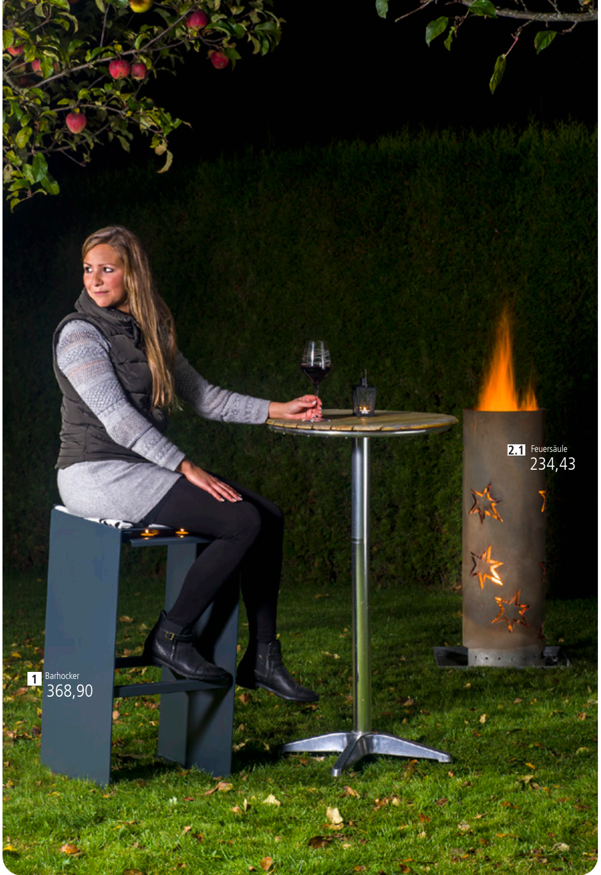
1 Barhocker 368,90