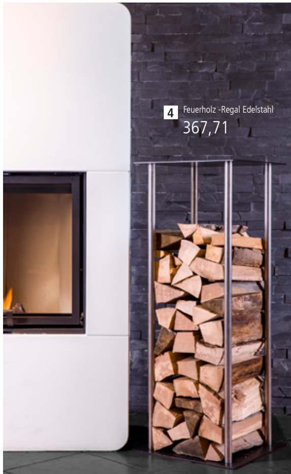
4 Feuerholz - Regal Edelstahl 367,71