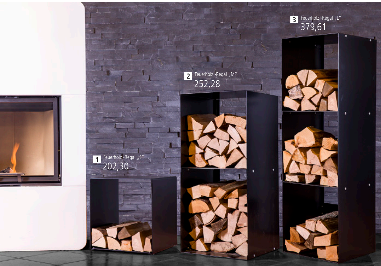
1 Feuerholz-Regal „S“ 202,30