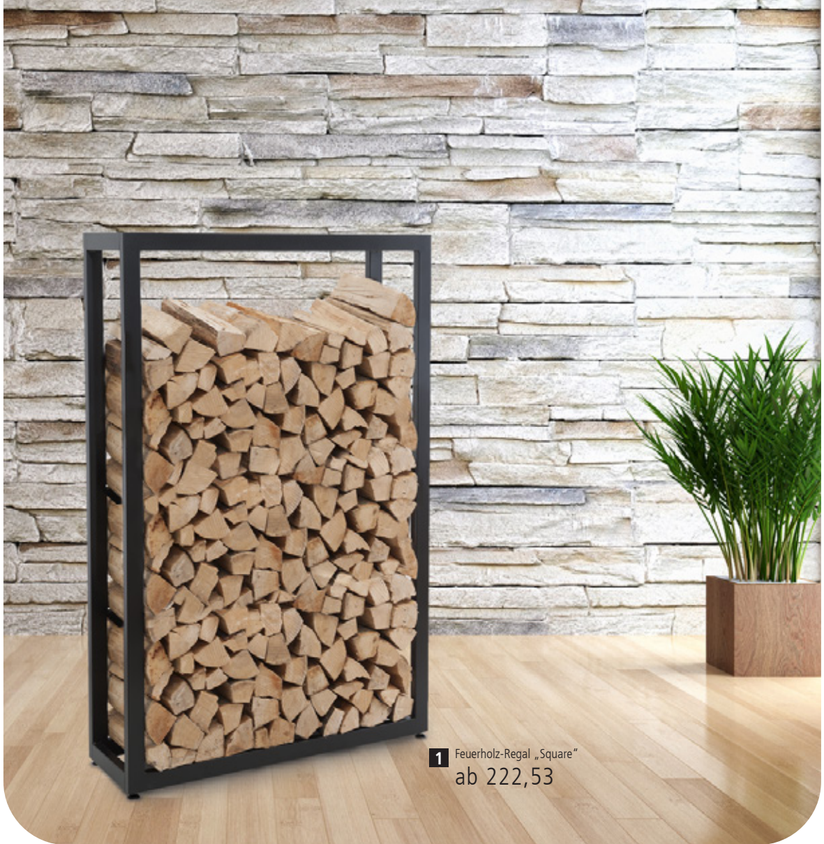
1 Feuerholz-Regal „Square“ ab 222,53